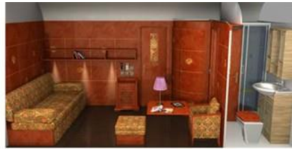
Superior Suite - day