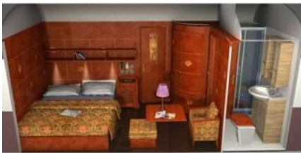
Superior Suite - night