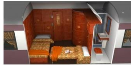
Standard Suite - night

Al Andalus: Las suites Gran Lujo (Superior) & Junior (Estándar)